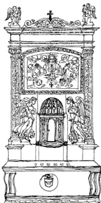
4. Hipotetyczna rekonstrukcja pierwotnej formy tabernakulum Padovana w katedrze na Wawelu, wg. J. Miziołka, rys. J. Kowalczyk

go, wybitnego humanisty, który był królewskim po- wiernikiem i jednym z głównych mecenasów sztuki w Polsce owego czasu. Tabernakulum zostało ustawio- ne w prezbiterium katedry, na lewo od głównego ołta- rza, nieopodal nagrobka Władysława Łokietka i grobu królowej Jadwigi. W roku 1605 tabernakulum przenie- siono do kaplicy Mariackiej (Batorego), znajdującej się na zamknięciu obejścia prezbiterium, a niedługo po- tem, pomiędzy rokiem 1645 a 1647, rozebrano całko- wicie. Uważa się, że częścią tego niestniejącego już tabernakulum jest renesansowe marmurowe cyborium w formie tempietta (kolistej świątynki), które znajdu- je się w drewnianym kościele w Modlnicy k. Krakowa. Ono właśnie, jako mieszczące w sobie Najświętszy Sa- krament, byłoby owym przedmiotem czci aniołów. Według jednej z ostatnich, hipotetycznych rekon- strukcji tabernakulum, którą zaproponował prof. Jerzy Miziołek, elementem tego dzieła byłaby także płasko- rzeźbiona płyta z przedstawieniem Trójcy Świętej, dziś wtórnie wmurowana w barokowy ołtarz w kapli- cy bp. Tomickiego przy katedrze krakowskiej.