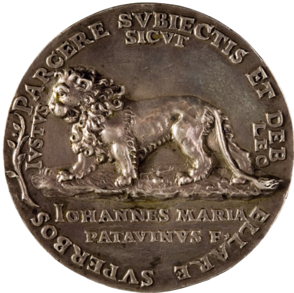
3. Gian Maria Mosca zw. Padovano, Rewers medalu portretowego królewicza Zygmunta Augusta z sygnaturą rzeźbiarza: IOHANNES MARIA PATAVINVS F. (Jan Maria Padwańczyk wykonał), 1532, Muzeum Narodowe w Krakowie

Od momentu realizacji tego pierwszego zlecenia królewskiego, Padovano rozwinął szeroką działalność rzeźbiarską i architektoniczną. Dowodem wysokiej rangi jego twórczości jest fakt, że do jego zleciodawców należeli możni z najwyższych sfer ówczesnej Rzeczypospolitej. Wykonywał on nagrobki m.in. dla arcybiskupa gnieźnieńskiego Andrzeja Krzyckiego (1538), dla biskupa poznańskiego Stanisława Oleśnickiego (1540) oraz dla biskupa krakowskiego Piotra Gamrata (1545), ten ostatni finansowany przez królową Bonę. Do katedry w Wilnie sporządzał nagrobki zmarłych żon króla Zygmunta Augusta: Elżbiety Habsburżanki (1546–1552) i Barbary Radziwiłłówny (od 1553). Prowadził także prace (nieukończone) przy nagrobku samego Zygmunta Augusta, pochowanego w kaplicy Zyguntowskiej. Po śmierci hetmana wielkiego koronnego Jana Amora Tarnowskiego Padovano wznosił w farze w Tarnowie (obecnie katedra) monumentalny pomnik nagrobny, który później został przezeń rozbudowany dla pomieszczenia posągu syna hetmana, Jana Krzysztofa Tarnowskiego (1561–1567). Wykonywał także prace architektoniczne dla zamku królewskiego na Wawelu (odrzwia i okna, 1558), do krakowskich Sukiennic po ich pożarze w roku 1555, biskupom krakowskim projektował podmiejską rezydencję na Prądniku (1551), a potem wznosił pałac na ulicy Wiślniej (przed 1567, pałac spłonął w końcu