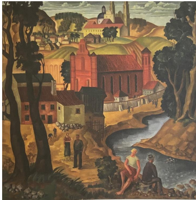
Leon Kosmulski, Krajobraz z postaciami (praca dyplomowa), olej na płótnie, 1936, The Museum of Vilnius Academy of Arts

Co my wiemy o międzywojennym Wilnie? Nadal niewiele, a jeszcze mniej o sztuce w tamtym okresie. Dlatego wielowątkowy obraz tego miasta ma za zadanie ukazać wystawa „Wilno, Vilnius, Vilne 1918-1948. Jedno miasto - wiele opowieści” zorganizowana w Muzeum Narodowym w Krakowie wspólnie z Litewskim Narodowym Muzeum Sztuki w Wilnie.